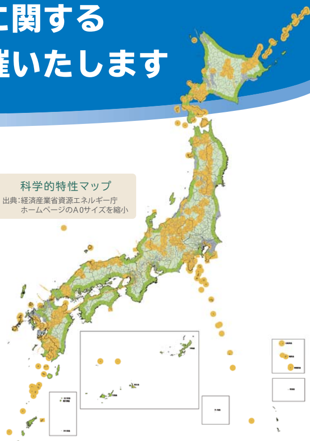
科学的特性マップ 出典：経済産業省資源エネルギー庁 ホームページのA0サイズを縮小

※本説明会は、謝金提供またはそれに類する便益供与等による参加者募集および 一般的な周知を超える参加要請をしない旨を徹底のうえ開催しております。