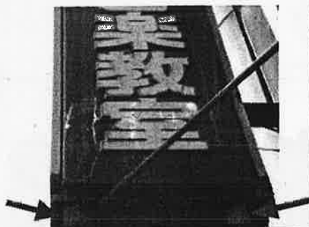
腐食して穴が開いています☹

日ごろのチェックも必要ですが、目安として設置後10年以上経過した看板は、専門家の点検を受けるようにしましょう。 ※年数を問わず専門家の点検を義務付けている自治体もあります。