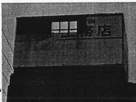
広告板が割られています☹