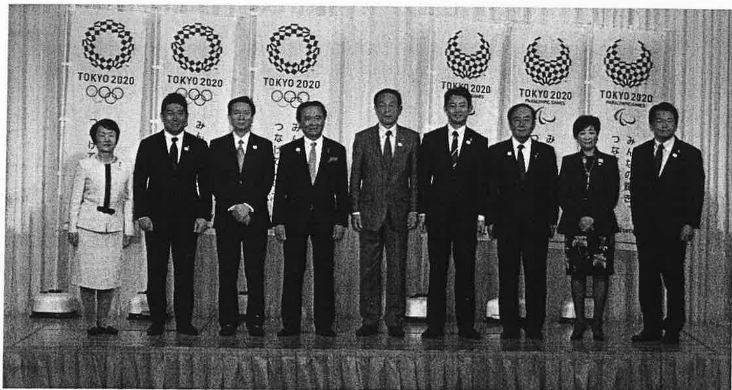
第72回九都県市首脳会議の出席者