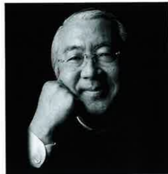
公益社団法人 全国調理師養成施設協会

このフェスタが、食に関わる職業人をめざす学生とその教員、そして、それらを取り巻くすべての人々の資質の向上、情報交換、交流促進の場となり、さらに、一般の人々が食育をとおり、すこやかな未来に羽ばたくきっかけとなることを心から願っております。